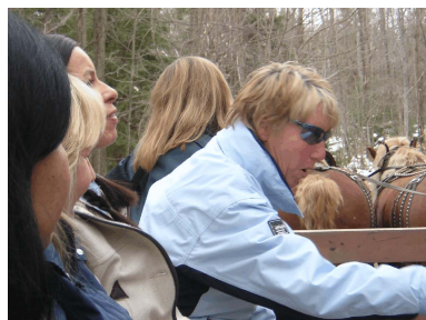
Fulton's Pancake House & Sugar Bush Pakenham, Ontario avril 2004